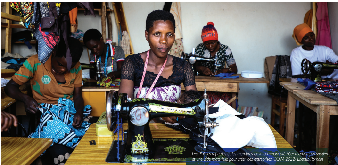
Les PDI, les rapatriés et les membres de la communauté hôte reçoivent un soutien et une aide matérielle pour créer des entreprises