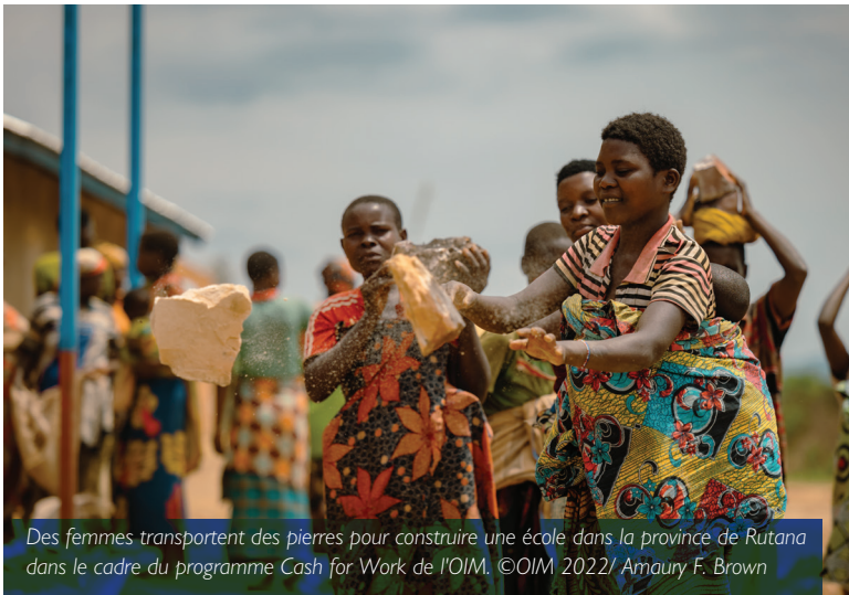
Des femmes transportent des pierres pour construire une école dans la province de Rutana dans le cadre du programme Cash for Work de l'OIM.

Dans le cadre de son mandat mondial sur la mobilité et la migration, l'OIM a développé des capacités institutionnelles en matière de programmes de transition et de relèvement qui utilisent des approches fondées sur des principes de développement pour s'attaquer de manière globale aux causes profondes des déplacements forcés et irréguliers. Cette approche repose sur trois piliers: